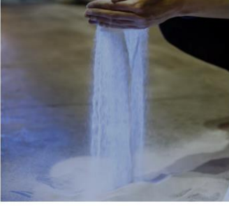
we • lead