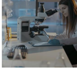
we • innovate