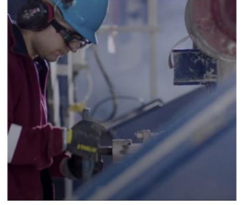
we • challenge